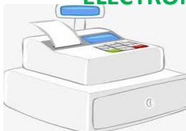
Controlador Fiscal homologado