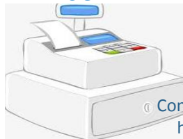
Controlador Fiscal homologado