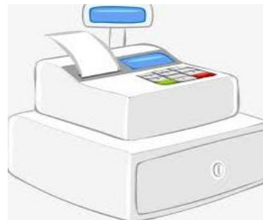
Controlador Fiscal homologado